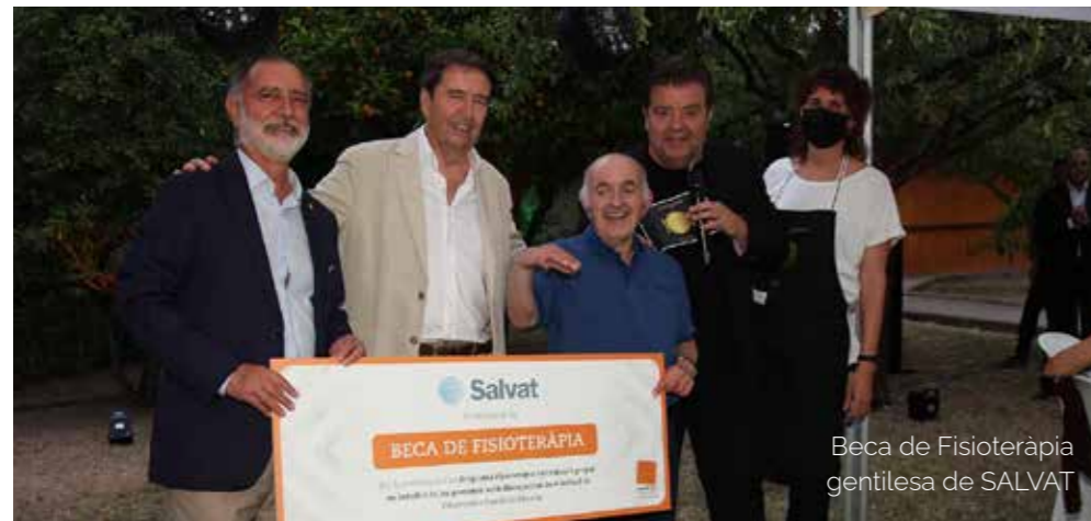
Beca de Fisioteràpia gentilesa de SALVAT

Com cada any es va fer entrega de totes les Beques per a aquest any als membres de la Fundació