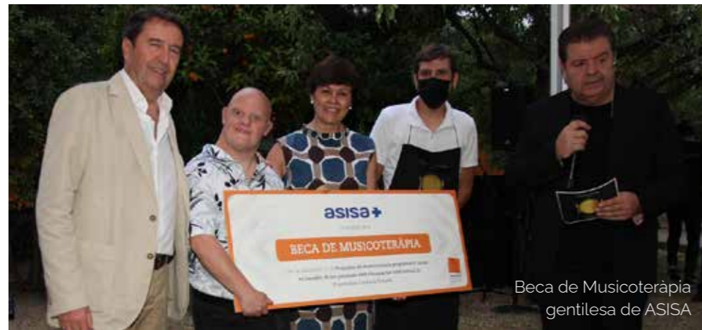
Beca de Musicoteràpia gentilesa de ASISA