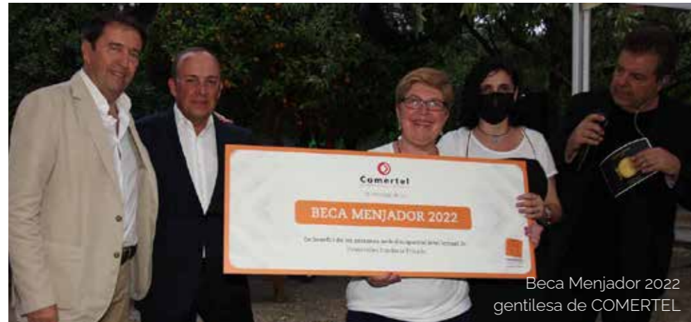
Beca Menjador 2022 gentilesa de COMERTEL