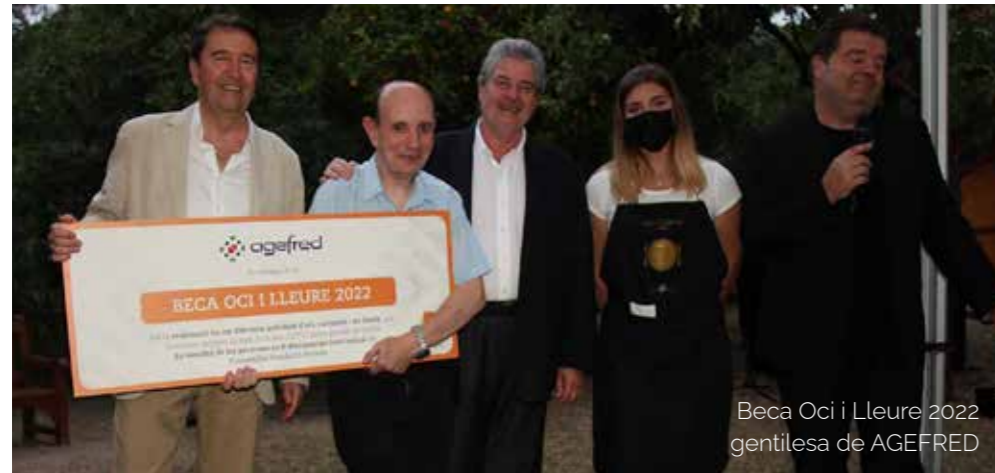
Beca Oci i Lleure 2022