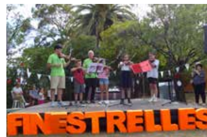
Imatges de la jornada de Portes Obertes on veiem gaudir a tots els assistents de les activitats que es van preparar.