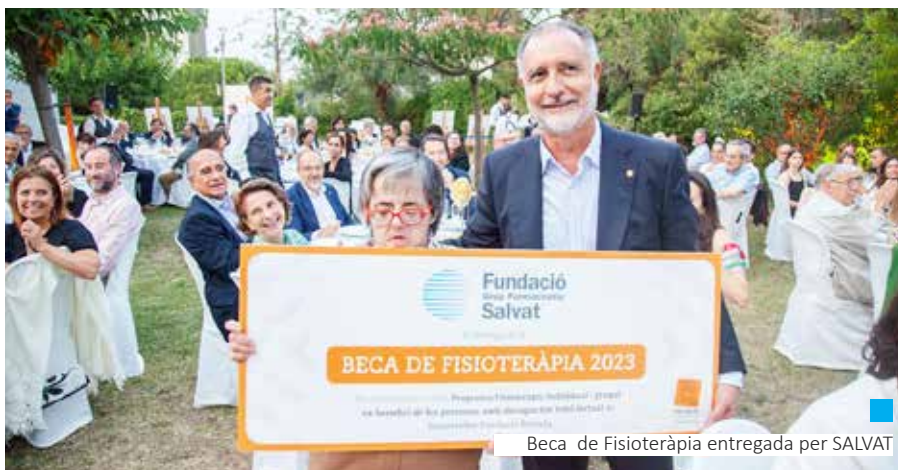
Beca de Fisioteràpia entregada per SALVAT