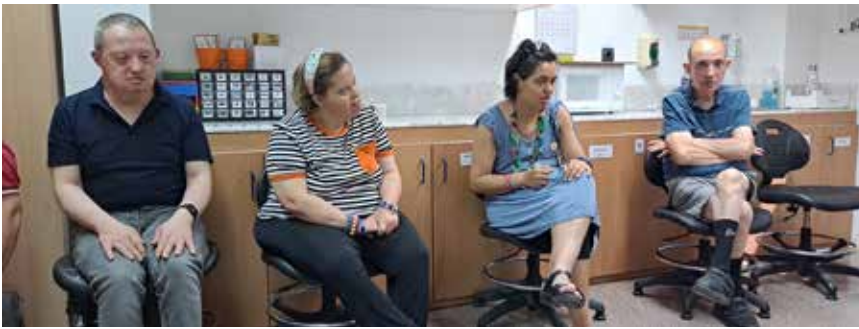
Imatges del grup de treball, durant la sessió de suport conductual positiu.

Les entitats del sector de la discapacitat intel·lectual evolucionem amb els temps sempre amb la vocació d'oferir el millor servei possible a les persones per les quals treballem. I això implica ajustar-se als nous models de suports que posen en primer lloc els valors de la persona, el respecte a la seva dignitat i les seves preferències, el que de ben segur impacta positivament en la seva qualitat de vida.