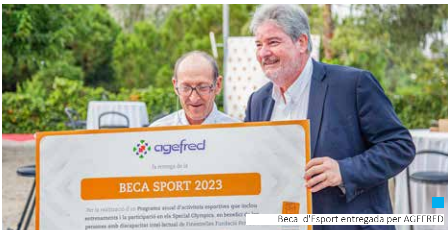
Beca d'Esport entregada per AGEFRED