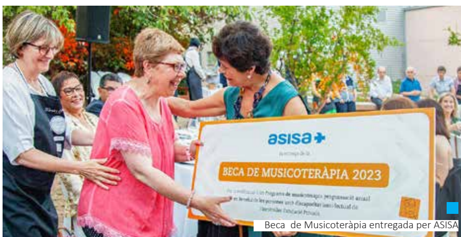
Beca de Musicoteràpia entregada per ASISA